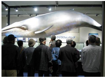
比和自然科学博物館