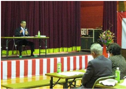
講演「高齢者福祉の現状と展望」